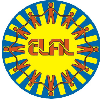
EESTI LASTEAEDNIKE LIIT